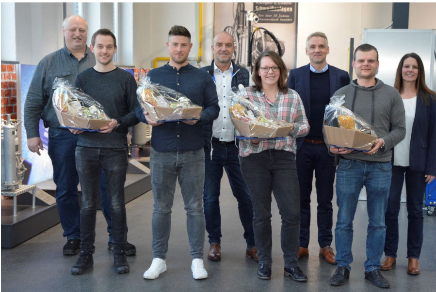
Bild 4: Diese Mitarbeiter feierten dieses Jahr ihr 10-jähriges Jubiläum.