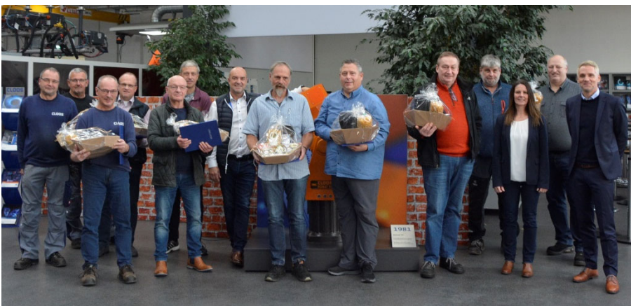
Bild 2: Diese Mitarbeiter halten CLOOS seit 40 und 50 Jahren die Treue.